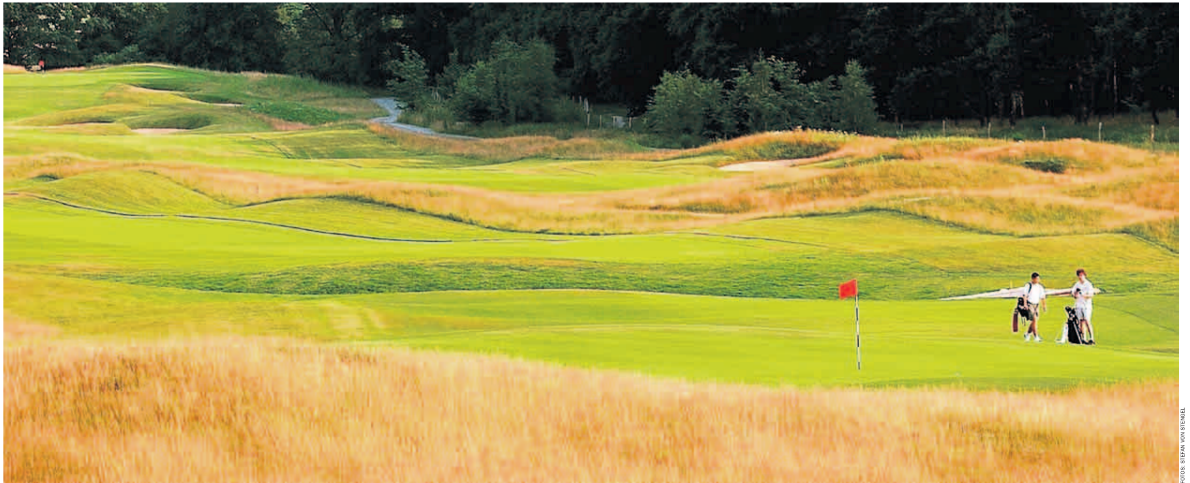
1 Golfen wie in Großbritannien: Der Faldo-Kurs im brandenburgischen Bad Saarow (Sporting Club Berlin) hat mit recht engen Spielbahnen und enorm vielen tiefen „pot bunkers“ den höchsten Schwierigkeitsfaktor

VON REINHOLD SCHNUPP UND STEFAN VON STENGEL