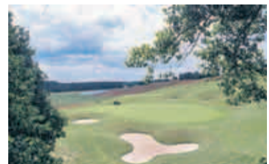
7 Sandy-Lyle-Course von Schloß Wilkendorf - zu Unrecht häufig unterschätzt