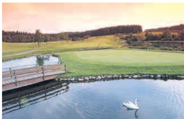
5 GC Schwanhof. Eine Anlage mit fast amerikanisch anmutendem Standard

Die Namen der Architekten geben einen weiteren Hinweis darauf, was in Deutschland in den zurückliegenden Jahren geschehen ist. Auf Gut Lärchenhof hat Jack Nicklaus die Planung übernommen. Deutschlands bester Golfer, Bernhard Langer, hat mit seinem Turnier, dem German Masters, den