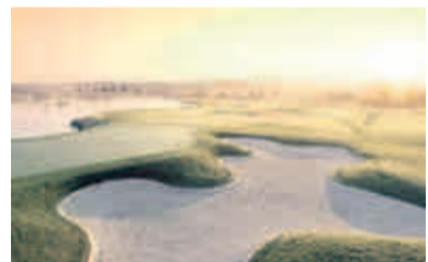
4 Gut Lärchenhof, bis 2005 Heimat des German Masters von Bernhard Langer