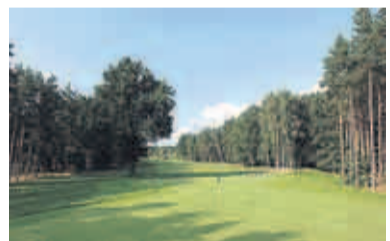
3 Der Palmer Course von Bad Saarow (Sporting Club Berlin)