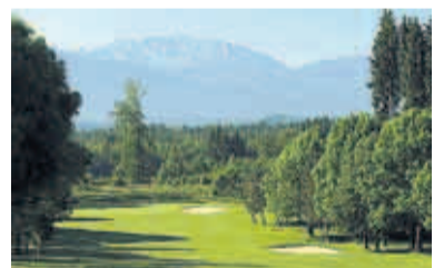
6 Golfclub Beuerberg - Bayerischer Wohlfühlplatz mit Alpenblick