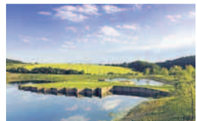
10 GC Hardenberg. Im Foto: Signature Hole mit „Keilerkopf“-Inselgrün

men vermag. Golf ist auf solchen Plätzen nicht immer ein Vergnügen. Aber wer, andererseits, will schon schöne Ausblicke genießen, wenn es darum geht, ehrliche, faire Herausforderungen zu bestehen und Golf am Limit nahe von Meisterschaftsplätzen der Profis zu spielen? Der Blick über die besten Anlagen im Lande, den die WELT alle zwei Jahre wagt, bewertet Kurse, die die strategische Planung der Schläge, ein Course Management, zwingend erforderlich macht, höher als Plätze, die zwar landschaftlich fast vollkommen sind, aber Kompromisse eingehen müssen, wie etwa Beuerberg bei München (Platz neun) mit einem unvergleichlichen Blick in die Alpen. Aber dort erfüllen nicht alle Bahnen gleichermaßen höchste Ansprüche, auch vom Unterboden her: Golf ist in Deutschland zu einem ernsthaften Sport geworden. Binnen zehn Jahren hat ein Kulturwandel stattgefunden. Golf kann Abwechslung und Hobby sein, aber es geht auch anders. Darum werden den Top Ten der WELT ambitionierte Spieler eher zustimmen als Hobbyspieler.