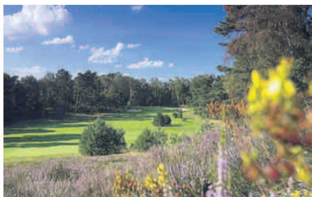
8 Hamburger GC Falkenstein. Ein Klassiker, ein Juwel unter den deutschen Plätzen