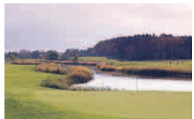
2 Der Südplatz des Golf & Country Club Seddiner See (mit Doppelgrün)